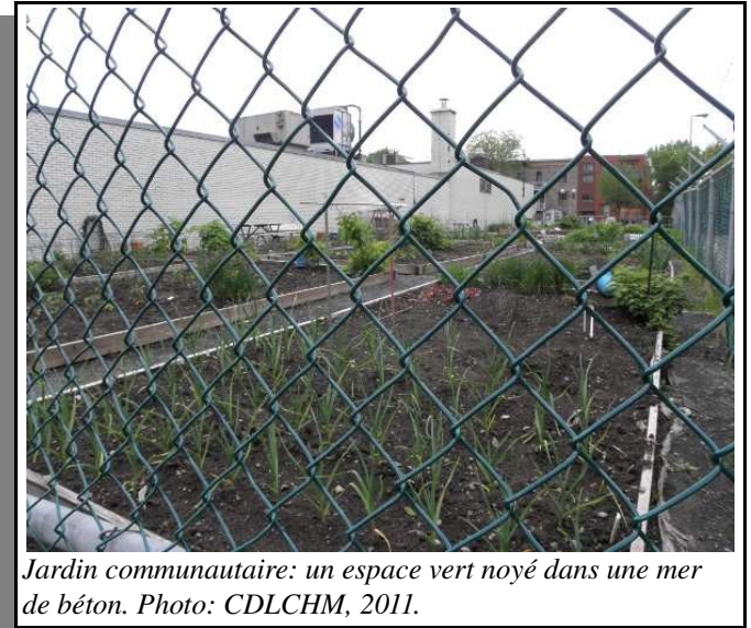
Jardin communautaire: un espace vert noyé dans une mer de béton. Photo: CDLCHM, 2011.