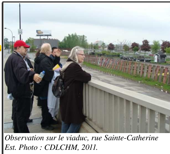
Observation sur le viaduc, rue Sainte-Catherine Est. Photo : CDLCHM, 2011.

Les participantes et les participants mentionnent que la qualité de vie dans le quartier, bien que s'étant améliorée depuis quelques années, est au mieux « moyenne ». Plusieurs raisons appuient cette perception : le bruit et la poussière dus à la circulation sur les rues Notre-Dame et Sainte-Catherine Est, mais aussi la prostitution de rue, la saleté des ruelles, le manque d'infrastructures et la sécurité.