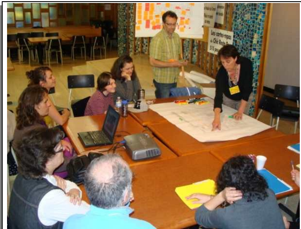
La réflexion collective, l'autoformation, l'utilisation de l'expertise citoyenne sont des principes fondamentaux de l'OPA. Photo: CDLCHM, 2011.