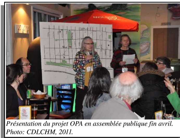
Présentation du projet OPA en assemblée publique fin avril. Photo: CDLCHM, 2011.

structures pour adolescentEs : hébertisme, blocs pour skateboard, paniers de basketball, voire bloc d'escalade et tables de pique-nique. Lier la piste cyclable au tout.